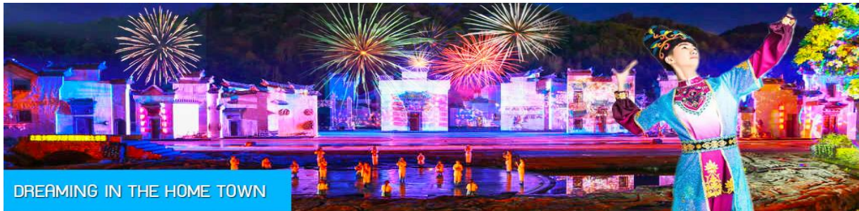
DREAMING IN THE HOME TOWN

หลังอาหารนำท่านเดินทางเข้าที่พัก หรือท่านสามารถเลือกซื้อโปรแกรมเสริม เป็นบัตรชมการแสดง ชุด DREAMING IN THE HOME TOWN เป็นการแสดงบนเวทีขนาดใหญ่ที่จัดสร้างขึ้นกลางแจ้ง ท่ามกลางธรรมชาติที่มีภูเขาเป็นฉากหลัง ใช้ทุนสร้างกว่า 280 ล้านบาท เป็นการแสดงที่น่าดูชมที่สุดในมณฑลเจียงซี แต่ละครจากการแสดงมีการออกแบบเวที ฉากประกอบที่พิถีพิถัน ประณีต และอลังการ ใช้ทีมงานนักแสดงหลายร้อยคน และระบบแสง สี เสียงที่ทันสมัยประกอบในการแสดง