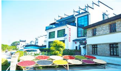
หมู่บ้านโบราณ สือเหมินซุน