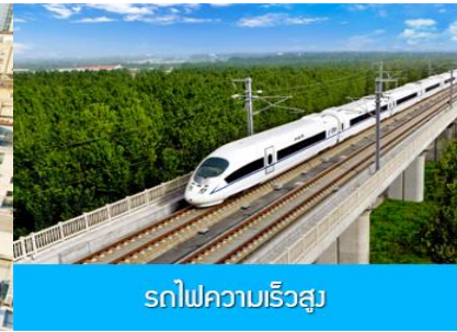
รถไฟความเร็วสูง