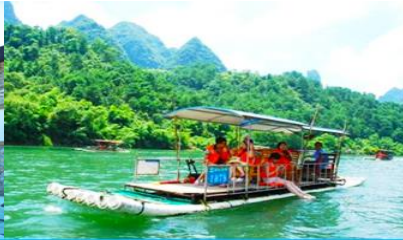
ล่องแพไม้ไผ่