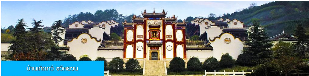
บ้านเกิดกวี ชวีหยวน