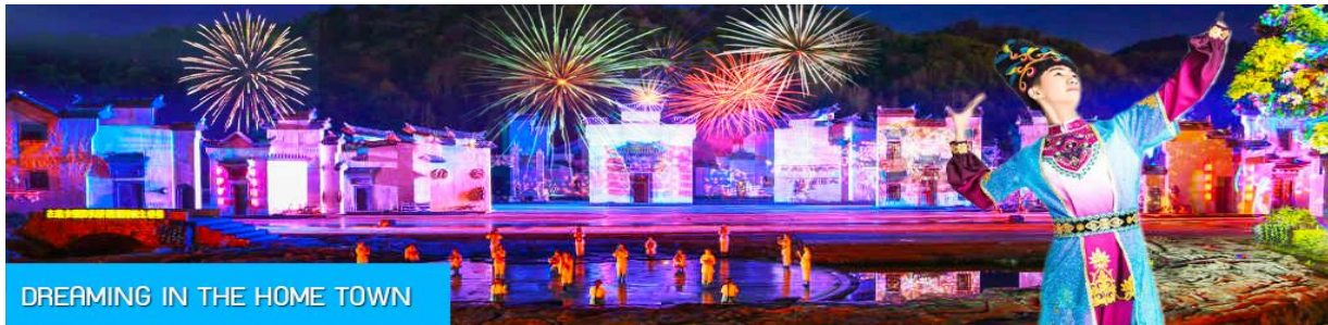
DREAMING IN THE HOME TOWN

หลังอาหารนำท่านเดินทางเข้าที่พัก หรือท่านสามารถเลือกซื้อโปรแกรมเสริม เป็นบัตรชมการแสดง ชุด DREAMING IN THE HOME TOWN เป็นการแสดงบนเวทีขนาดใหญ่ที่จัดสร้างขึ้นกลางแจ้ง ท่ามกลางธรรมชาติที่มีภูเขาเป็นฉากหลัง ใช้ทุนสร้างกว่า 280 ล้านบาท เป็นการแสดงที่น่าดูชมที่สุดในมณฑลเจียงซี แต่ละครจากการแสดงมีการออกแบบเวที ฉากประกอบที่พิถีพิถัน ประณีต และอลังการ ใช้ทีมงานนักแสดงหลายร้อยคน และระบบแสง สี เสียงที่ทันสมัยประกอบในการแสดง