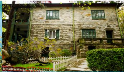
เรือนรับรอง หม่อมหลู