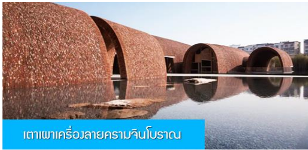
เตาเผาเครื่องลายครามจินโบราณ