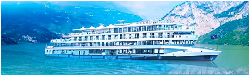
ล่องเรือชมเขื่อนสามผา