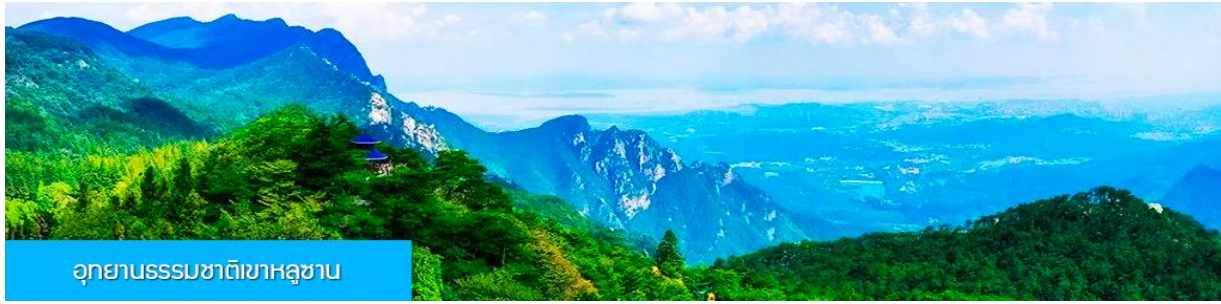
อุทยานธรรมชาติเขาหลูซาน