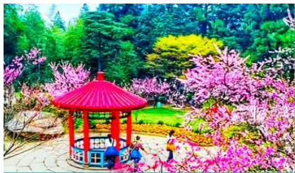
สวนฮวาจิ้ง