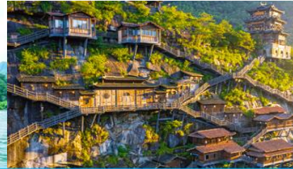
อุทยาน วังเซียนกู่

วันที่ เมืองวู่หยวน-หมู่บ้านโบราณเหียนสือเหมินซุน-ล่องแพไม้ไผ่ - เมืองซังเหรา – หุบเขาเทวดาวังเซียนกู่