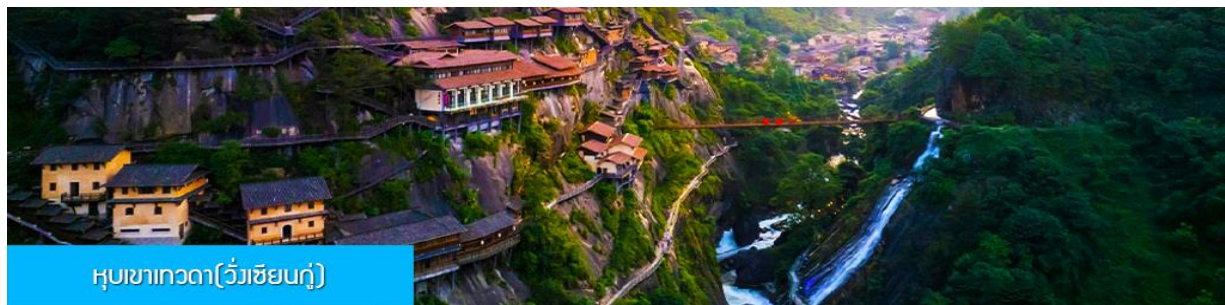
หุบเขาเทวดา(วังเซียนกู่)

หลังอาหารนำท่านเดินทางสู่เมือง ซังเหรา 上饶 (ระยะทาง 127 กม. ใช้เวลาเดินทางโดยรถบัสราว 2 ชั่วโมง)