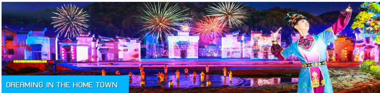
DREAMING IN THE HOME TOWN

หลังอาหารนำท่านเดินทางเข้าที่พัก หรือท่านสามารถเลือกซื้อโปรแกรมเสริม เป็นบัตรชมการแสดง ชุด DREAMING IN THE HOME TOWN เป็นการแสดงบนเวทีขนาดใหญ่ที่จัดสร้างขึ้นกลางแจ้ง ท่ามกลางธรรมชาติที่มีภูเขาเป็นฉากหลัง ใช้ทุนสร้างกว่า 280 ล้านบาท เป็นการแสดงที่น่าดูชมที่สุดในมณฑลเจียงซี แต่ละครจากการแสดงมีการออกแบบเวที ฉากประกอบที่พิถีพิถัน ประณีต และอลังการ ใช้ทีมงานนักแสดงหลายร้อยคน และระบบแสง สี เสียงที่ทันสมัยประกอบในการแสดง