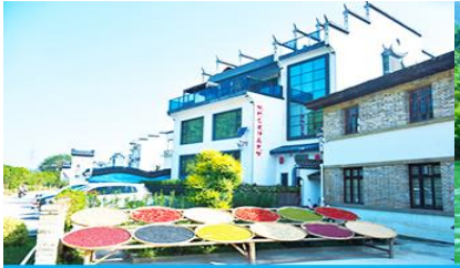
หมู่บ้านโบราณ สือเหมินซุน