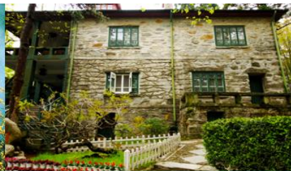
เรือนรับรอง หม่ยหลู