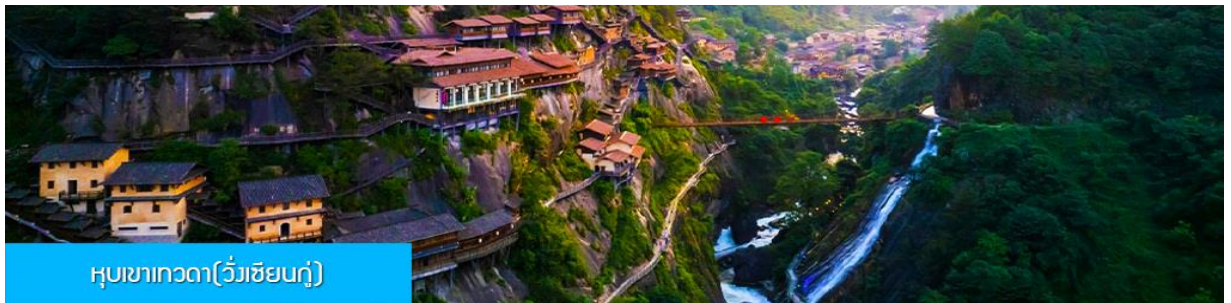
หุบเขาเทวดา(วังเซียนกู่)

หลังอาหารเช้าท่านเดินทางสู่เมือง ซังเหรา 上饶 (ระยะทาง 127 กม. ใช้เวลาเดินทางโดยรถบัสราว 2 ชั่วโมง)