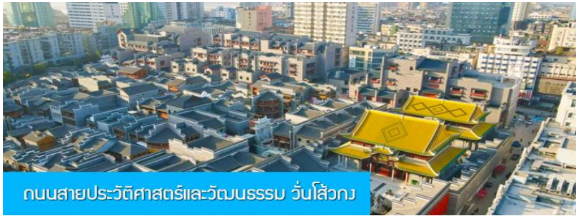
ถนนสายประวัติศาสตร์และวัฒนธรรม วันโ้วกง

พักที่ โรงแรม JIANGNAN HAOTING HOTEL ระดับ 4 ดาวท้องถิ่นหรือเทียบเท่าในเมืองซ่งเหรา