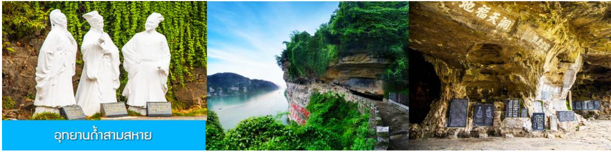
อุทยานถ้ำสามสหาย