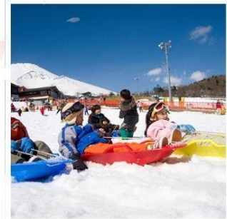
ลานสกีเยติ