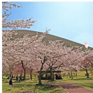
ซากุระ โนะ ซาโตะ