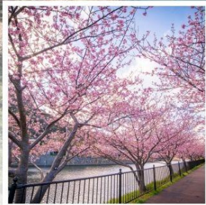
เทศกาลคาวาซุ ซากุระ