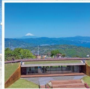
มิโระ คาเฟ่321