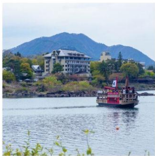
ล่องเรืออปปะระะ