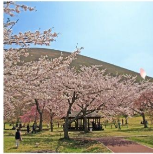
ซากุระ โนะ ซาโตะ