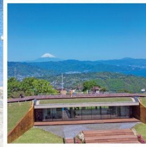
มิโระ คาเฟ่321