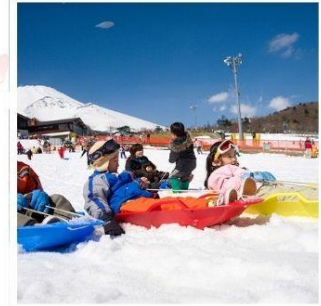
ลานสกีเยติ