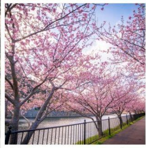
เทศกาลคาวาซุ ซากุระ