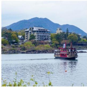
ล่องเรืออปปะระ