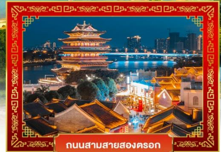
ถนนสามสายสองตอ