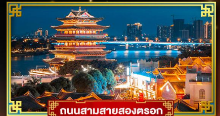
ถนนสามสายสองตอรอก