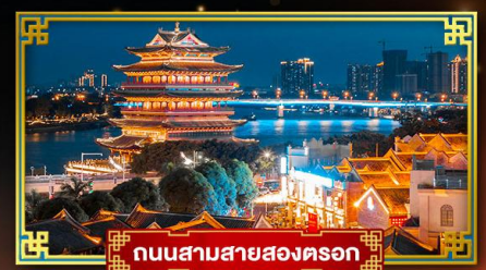
ถนนสามสายสองตอรอก