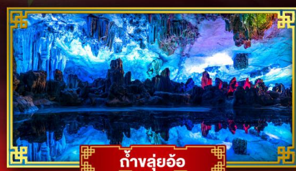
ถ้ำลุย้อ

"ดินแดนแห่งสายน้ำและขุนเขา" สัมผัสประสบการณ์นั่งบอลลูนชมวิวมุมสูง