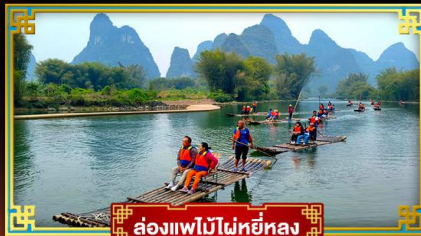
ล่องแพไม้ไผ่หยี่หลง