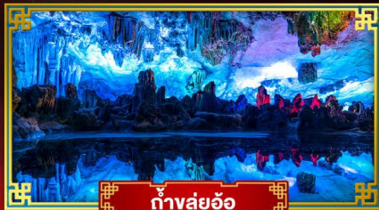
ถ้ำลุย้อ

"ดินแดนแห่งสายน้ำและขุนเขา" สัมผัสประสบการณ์นั่งบอลลูนชมวิวมุมสูง