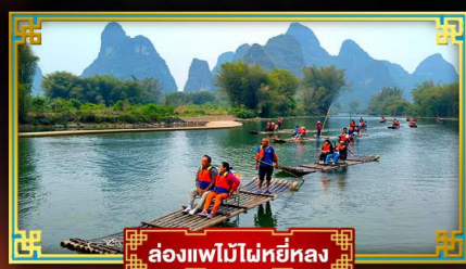
ล่องแพไม้ไผ่หยี่หลง