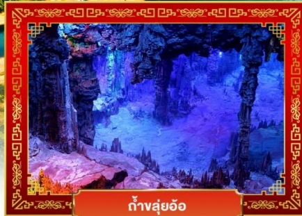
ถ้ำสุ่ยอ้อ