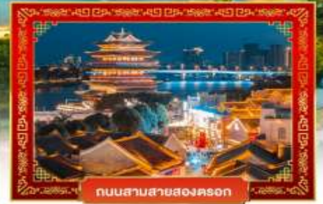
ถนนสายสองคอน