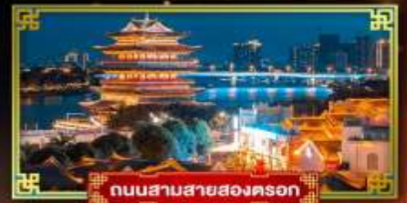
ถนนสามสายสองนครก