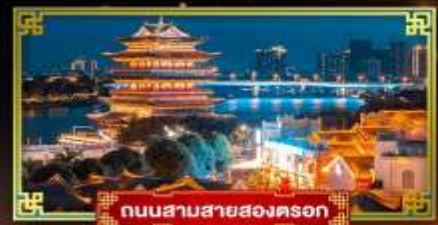
ถนนสามสายสองนครถก