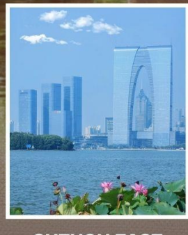
SUZHOU EAST GATE