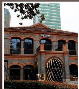
ย่านเฟิงเซินหลี่