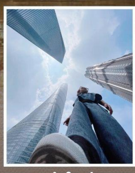
3 ตึกใหญ่ แห่งเมืองไฮ้