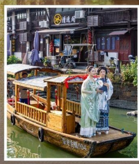
เมืองโบราณจีนซื้อ