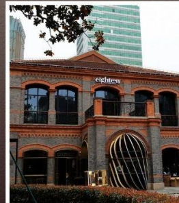
ย่านเฟิงเซินหลี่