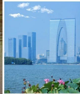
SUZHOU EAST GATE