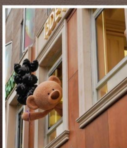
ถนนอันฟู่