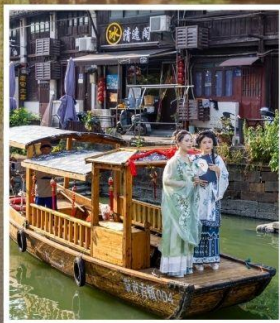
เมืองโบราณจีนซื้อ