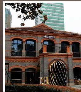
ย่านเฟิงเซินหลี่