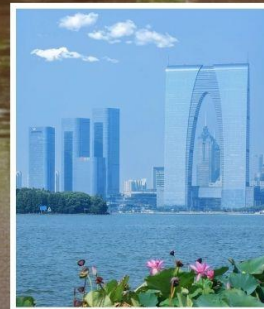
SUZHOU EAST GATE