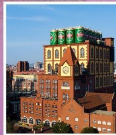
โรงงานเบียร์ซิงเต่า