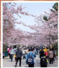
ซากระจงซาฮาน