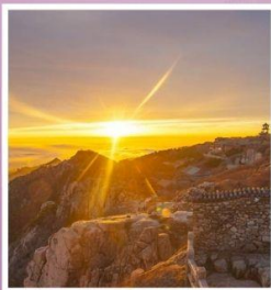
ยอดเขาอวิ้อว