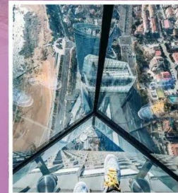
QINGDAO HAITIAN CENTER