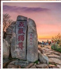
หินแกะสลักในสมัย ราชวงศ์ถัง