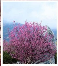
ชมดอกท้อภูเขาไถ่ซาฮาน