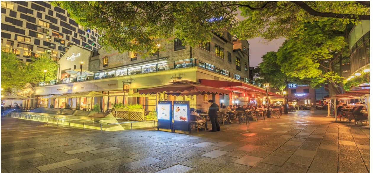
📍 พักที่ HOLIDAY INN EXPRESS SHANGHAI HOTEL หรือเทียบเท่าระดับ 4 ดาว

หลังอาหารค่านำท่านเที่ยวชม ซินเทียนตี้ ย่านฮิปเตอร์ใจกลางนครเซี่ยงไฮ้ ที่วัยรุ่นต้องมา กลายเป็นสถานที่ท่องเที่ยวติดอันดับต้นๆไปแล้ว สำหรับแหล่งช้อปปิ้งแห่งนี้ ไม่แพ้แหล่งช้อปปิ้งรุ่นพี่ อย่าง ถนนนานกิง ถนนคู่เจียง Yu Yuan Bazaar ถือว่าเป็นอีก 1 ไฮไลท์เด็ดของนครแห่งนี้ เนื่องจากเอกลักษณ์ที่ไม่เหมือนใคร สิ่งปลูกสร้างที่ใช้วัสดุแบบสถาปัตยกรรมแบบ Shikumen (ซิกเหมิน) การผสมผสานระหว่างสถาปัตยกรรมตะวันตกกับจีนเข้าด้วยกัน ทางเดินหิน กำแพงหิน ประตูหิน บ้านเมืองเก่าแต่ดูแลรักษาอย่างดี และอีก 1 ไฮไลท์ที่ห้ามพลาด ร้านเสื้อแบรนด์เนมเกาหลีสุดไวรัล MARDI MERCREDI SHOP มาเปิดช้อปปิ้งแรกในเมืองเซี่ยงไฮ้ ให้ท่านเลือกซื้อตามอัธยาศัย และยังมีร้านรองเท้าแบรนด์ดังต่างๆมากมาย เช่น ON CLOUD FLAGSHIP STORE