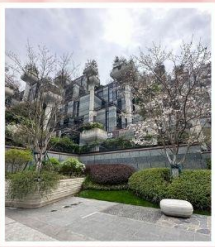
TIAN AN 1,000