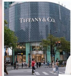
ถนนหวยไห้