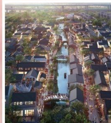
เมืองโบราณผานหลงกู่เจิน