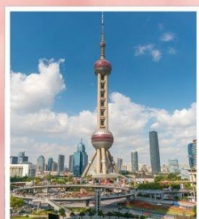
ชั้นชมหอไข่มุก