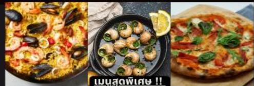
เมนูสุดพิเศษ !!

PAELLA ข้าวผัดสเปน / หอยแครงสด / พิซซ่ามากริตต้า