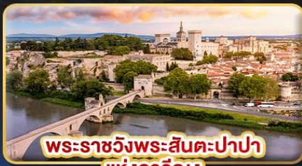
พระราชวังพระสันตะปาปา แห่งอเวญง