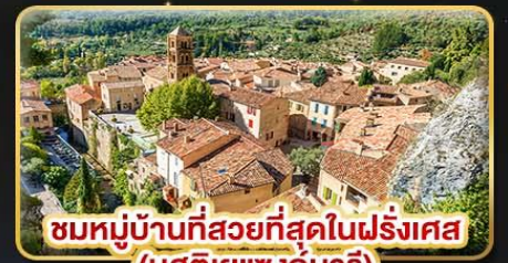
ชมหมู่บ้านที่สวยงามที่สุดในฝรั่งเศส (มูสตียาแซงก์มาร์)