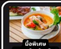
มือพิเศษ อาหารไทยในยุโรป

PAELLA ข้าวผัดสเปน / หอยแครงสด / พิซซ่ามากริตต้า