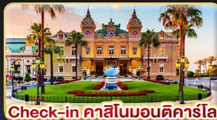
Check-in คาสิโนมอนติคาร์โล