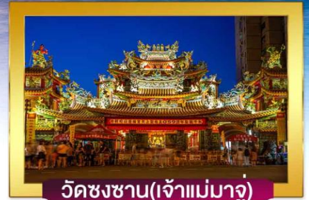
วัดชงซาน(เจ้าแม่มาจู่)