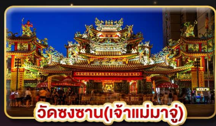
วัดชงชาน(เจ้าแม่มาจู่)