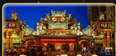
วัดชงชาน(เจ้าแม่มาจู่)