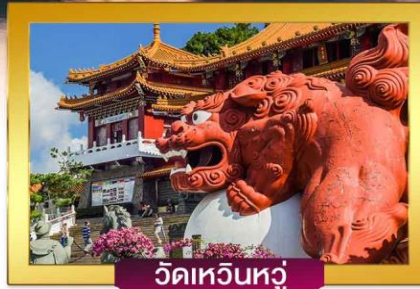
วัดเหวินหัว