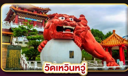
วัดเหวินหัว