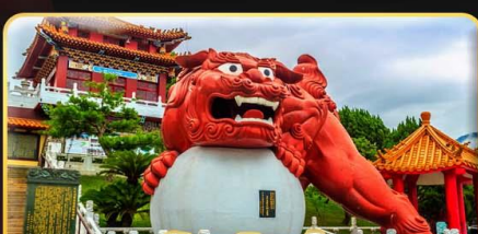
วัดเหวินหัว