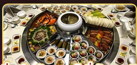
อิ่มอร่อยกับ..เมมูหม้อนึ่งจักรพรรดิ เสี่ยวหลงเปา ซาซิมิซูเฟอโตลัดได้ทุกวัน