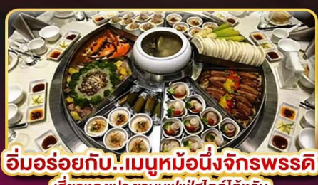
อิ่มอร่อยกับ..เมมูหม้อนึ่งจักรพรรดิ เสี่ยวหลงเปา ซาซิมิซูเฟอโตลัดได้ทุกวัน