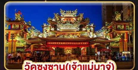
วัดชงชาน(เจ้าแม่มาจู่)