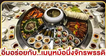
อิ่มอร่อยกับ..เมมูหม้อนึ่งจักรพรรดิ เสี่ยวหลงเปา ซาซิมูฟเฟสโตลได้ทุกวัน

ช้อปปังจู่ใจ..ตลาดซีเหมินติง ตลาดโกจงไนท์มาร์เก็ต กลอเรียฮาร์ทลิต