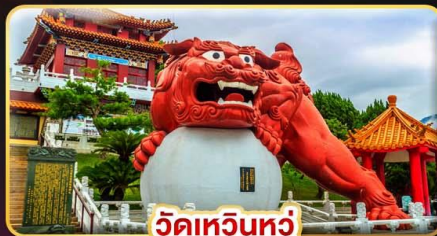
วัดหวินหัว