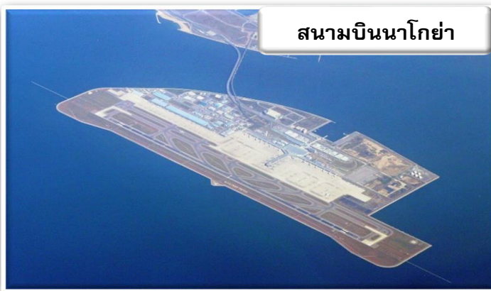
สนามบินนาโกย่า

บริการอาหารร้อนบนเครื่องพร้อมกับเมนูผลไม้สดเพื่อเติมเต็มความพิเศษไปพร้อมกับความสดชื่น