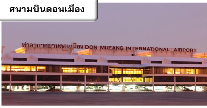
สนามบินดอนเมือง

เวลา 22.00 น.พร้อมกันที่ สนามบินดอนเมือง อาคารผู้โดยสารขาออกระหว่างประเทศเคาน์เตอร์ สายการบินไทยแอร์เอเชียเอ็กซ์เจ้าหน้าที่คอยให้การ ต้อนรับ ดูแลด้านเอกสาร เช็คอิน และสัมภาระใน การเดินทาง