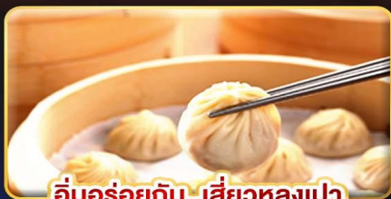
อ๋มอร่อยกับ..เสี่ยวหลงเปา

พิเศษ !! หน้อนึ่งจ๊กสวรดี้ , ไอศกรีม MIYAHARA