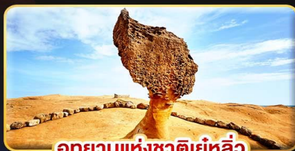
อุทยานแห่งชาติหยี่หลิว