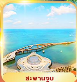
สะพานจูบ