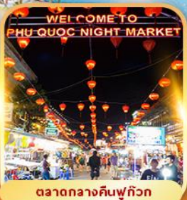
ตลาดกลางคืนฟู๊ก๊วก