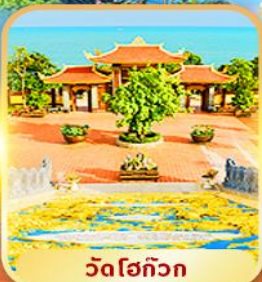
วัดโฮก๊วก