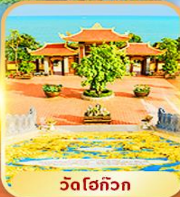
วัดโฮก๊วก