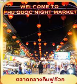
ตลาดกลางคืนฟู๊คว๊วก