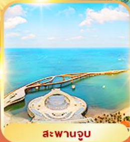
สะพานจูบ