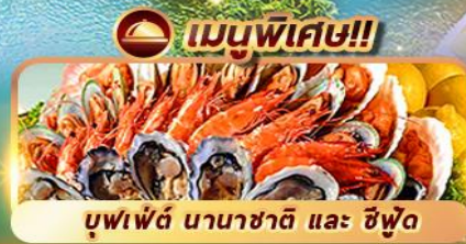
บุฟเฟ่ต์ นานาชาติ และ ซิฟูด