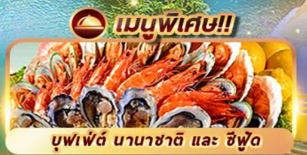
บุฟเฟ่ต์ นานาชาติ และ ซิวัด