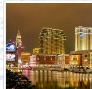
เดอะเวเนเซียน

ข้อปั้ง โทเทมบะฟรีเมียมเอ้าท์เล็ทส์ อย่างจุใจ เพลิดเพลินไปกับ กิจกรรมหิมะ บริเวณภูเขาไฟฟูจิ ล่องเรือชมความงามธรรมชาติใน ทะเลสาบคาวากุซึโกะ ชม เทศกาลประดับไฟ สุดอลังการ ณ หมู่บ้านเยอรมัน กราบไหว้ขอพรกับ เทพเจ้าองค์ไท่ส่วยเอี้ย วัดเปากง สัมผัสความอลังการของ เดอะเวเนเซียน รีสอร์ทระดับเวิลด์คลาส พักออนเซ็น 1 คืน!!! // อาหารพิเศษ... บุฟเฟ่ต์ขาปูยักษ์, เช็ท BBQ กรุ๊ปสบายๆ เพียง 20 ท่านเท่านั้น!!!