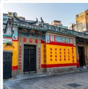
วัดเปากง