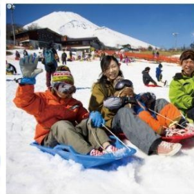
ลานสกีเยติ