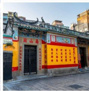
วัดเปากง