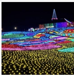
งานประดับไฟหมู่บ้านเยอรมัน