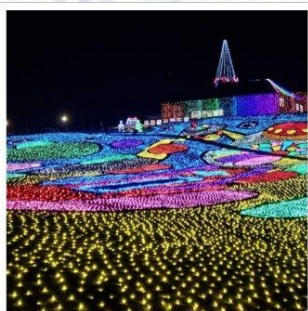
งานประดับไฟหมู่บ้านเยอรมัน