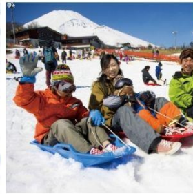
ลานสกีเยติ