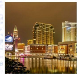
เดอะเวเนเซียน

ช้อปปัง โทเทมบะฟรีเมียมเอ้าท์เล็ทส์ อย่างจุใจ เพลิดเพลินไปกับ กิจกรรมหิมะ บริเวณภูเขาไฟฟูจิ ล่องเรือชมความงามธรรมชาติใน ทะเลสาบคาวากุซึโกะ ชม เทศกาลประดับไฟ สุดอลังการ ณ หมู่บ้านเยอรมัน กราบไหว้ขอพรกับ เทพเจ้าองค์ไท่ส่วยเอี้ย วัดเปากง สัมผัสความอลังการของ เดอะเวเนเซียน รีสอร์ทระดับเวิลด์คลาส พักออนเซ็น 1 คืน!!! // อาหารพิเศษ... บุฟเฟ่ต์ซาปูยักษ์, เช็ท BBQ กรุ๊ปสบายๆ เพียง 20 ท่าน เท่านั้น!!!