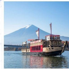
ล่องเรืออัปปะระะ