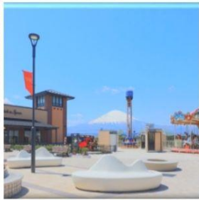
โทเทมบะฟรีเมียม เอ้าท์เล็ทส์