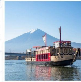
ล่องเรืออปปะระะ