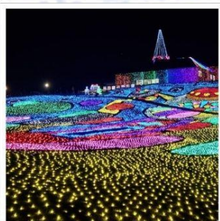
งานประดับไฟหมู่บ้านเยอรมัน