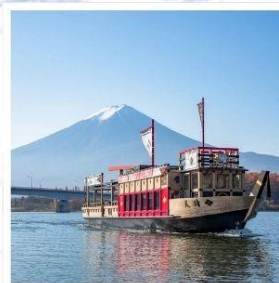
ล่องเรืออปปปะระะ