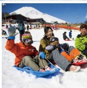
ลานสกีเยติ