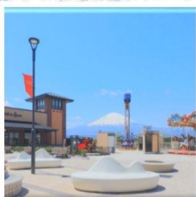
โกเทมบะฟรีเมียม เอ้าท์เล็ตส์