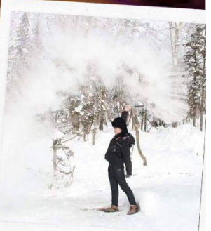
ภาพเขียน ICE AND SNOW