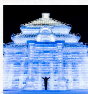
เทศกาลแกะสลักน้ำแข็ง