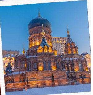
โบสถ์เซินโซเฟีย