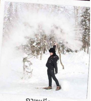
ภาพเขียน ICE AND SNOW