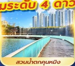
สวนน้ำตกคุณหมิง