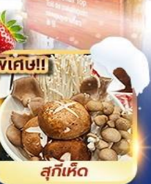
สุกี้เห็ด