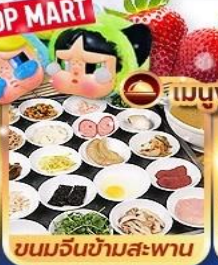
ขนมจีนข้ามสะพาน