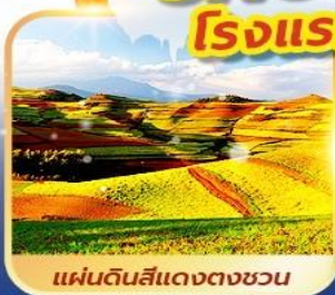
แผ่นดินสีแดงตงชวน