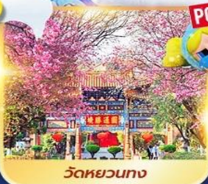
วัดหยวนทง