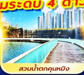
สวนน้ำตกคุณหมิง