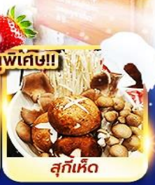
สุกี้เห็ด