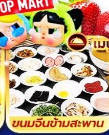
ขนมจีนข้ามสะพาน