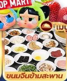
ขนมจีนข้ามสะพาน