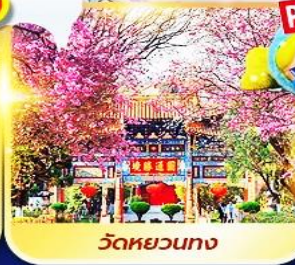
วัดหยวนทาง