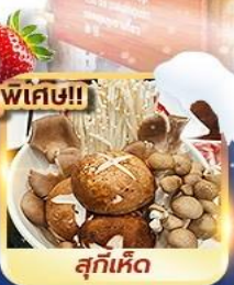
สุกี้เห็ด