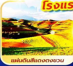
แผ่นดินสีแดงตงชวน