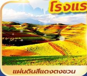
แผ่นดินสีแดงตงชวน