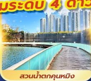
สวนน้ำตกคุณหมิง