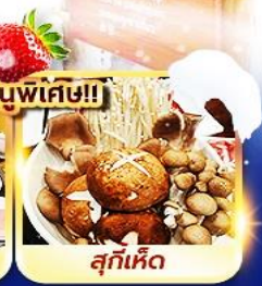
สุกี้เด็ด