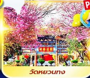
วัดหยวนทาง