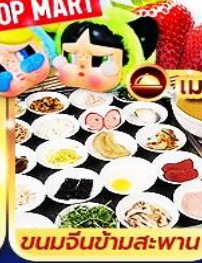
ขนมจีนข้ามสะพาน