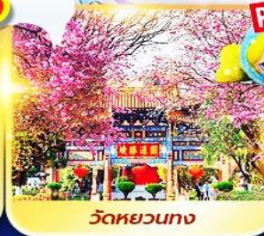
วัดหยวนทาง