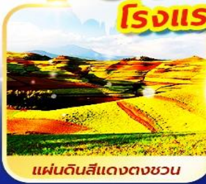
แผ่นดินสีแดงตงชวน