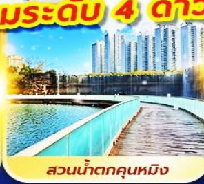
สวนน้ำตกคุณหมิง