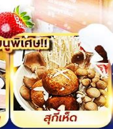
สุกี้เห็ด