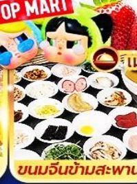
ขนมจีนข้ามสะพาน