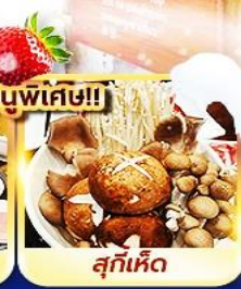
เมนูพิเศษ!! สุกี้เห็ด