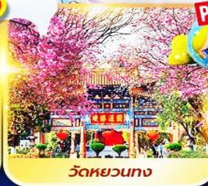
วัดหยวนทาง