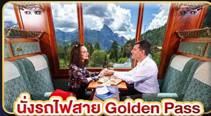
นั่งรถไฟสาย Golden Pass