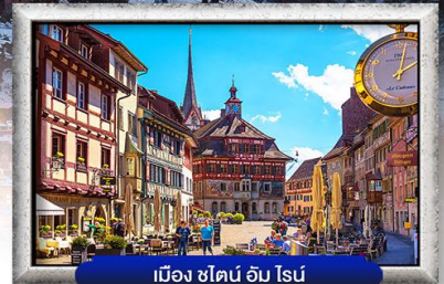
เมือง ซาโตน อัม ไนน์