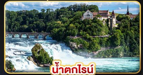
น้ำตกไรน์