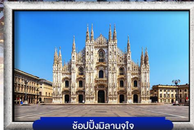
ชอปปิงมีลานจู๊