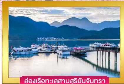
ล่องเรือทะเลสาบสุริยันจันทรา