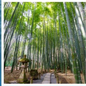
วัดโอโคะคุจิ