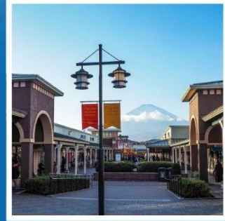
ช้อปปิ้งโทเทมบะ

สักการะพระใหญ่ไดบุทสึ ที่วัดโคโตคุอินก่อนขึ้นปี ช้อปปิ้งโทเทมบะ ฟรีเบียร์ เจ้ากัเลียส อย่างจุใจ เต็มเวลา หมู่บ้านโอชิโนะฮะคโค หมู่บ้านน้ำใสศักดิ์สิทธิ์ ประสบการณ์แสนสนุก ล่องคาบะบัส ชมฟูจิ สัมผัสวัฒนธรรมเช้าของเหล่าคนญี่ปุ่น ณ ตลาดปลาซึกิจิ เก็บภาพความประทับใจ ณ วัดโอโคะคุจิ ปาไฟแห่งคามาคุระ พักออนเซ็น 1 คืน // อาหาร : บุฟเฟ่ต์ซาบูโม่อื่น บุฟเฟ่ต์ซาบู อิสะะฟรีเดย์ 1 วัน โรงแรมใกล้รถไฟฟ้า 3 สาย ที่โตเกียว 2 คืน