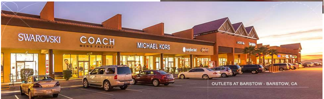
OUTLETS AT BARSTOW - BARSTOW, CA