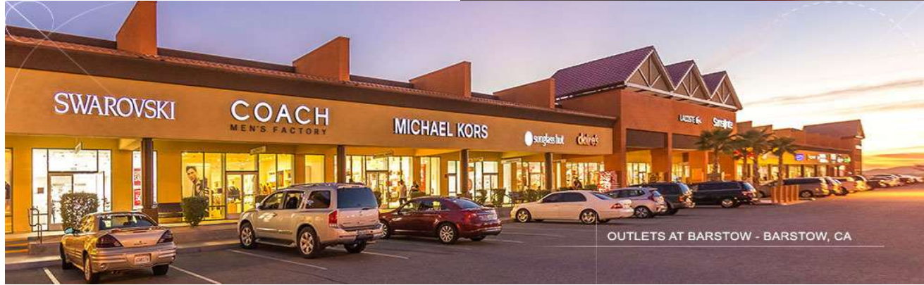
OUTLETS AT BARSTOW - BARSTOW, CA