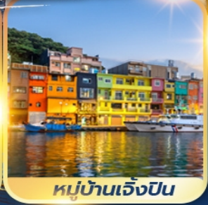
หมู่บ้านเจิ้งปิ่น