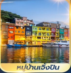
หมู่บ้านเจิ้งปิ่น