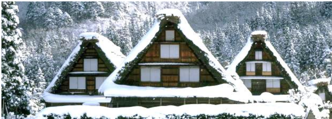
~ 5 ~

หมู่บ้านมรดกโลก ชิราคาวาโกะ หมู่บ้านแห่งนี้ ตั้งอยู่ในหุบเขาสูงห่างไกลความเจริญ ทำให้ยังคงรักษาขนบธรรมเนียม ประเพณีอันดั้งเดิมไว้ได้อย่างสมบูรณ์ มีเอกลักษณ์เฉพาะตัวที่เรียกว่า “กัสโช สุคุริ” (Gussho Style) โดยการสร้างหลังคาเป็นสามเหลี่ยมทรงสูงกว่า 60 องศาด้วยการพนมมือ และยังได้รับการขึ้นทะเบียนให้เป็นมรดกโลกในปี 1995 อีกด้วย