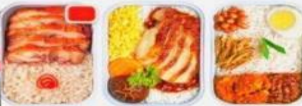
บริการอาหารร้อน ทั้งขาไป-ขากลับ