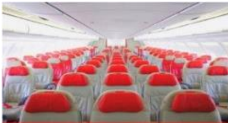
เครื่องบินใหญ่ 377 ที่นั่ง