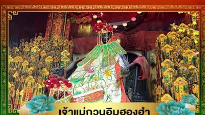
เจ้าแม่กวนอิมองค์ห้า