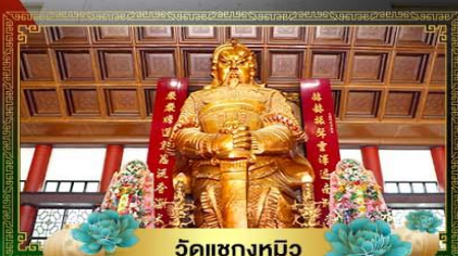
วัดเข่งหมิว