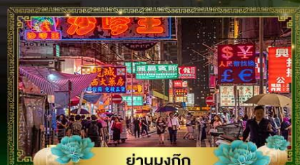
ย่านมงก๊ก