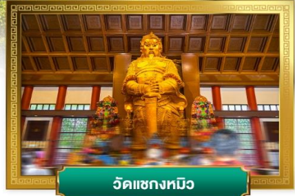
วัดแชงหมิว