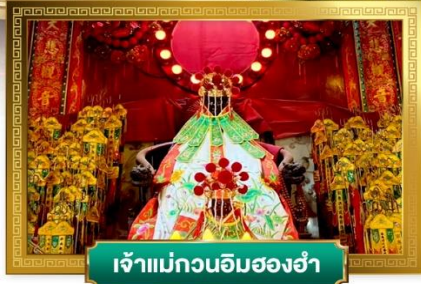
เจ้าแม่กวนอิมสองฮ่า