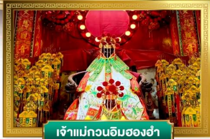
เจ้าแม่กวนอิมสองฮ่า