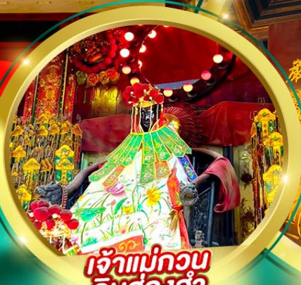
เจ้าแม่กวนอิม อิมอ่องฮำ