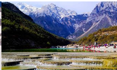
หุบเขาพระจันทร์สีน้ำเงิน "ไป๋สุ่ยเหอ"