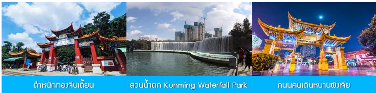
ต้าหนังกอวจินเตี้ยน

พักที่ JINJIANG HOTEL โรงแรมระดับ 4 ดาวท้องถิ่น หรือเทียบเท่าในเมืองคุนหมิง