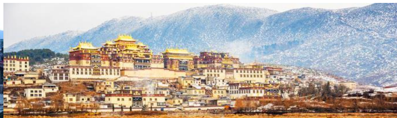
เมืองโบราณเซวกริลา