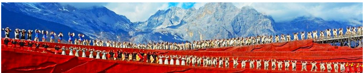
การแสดง IMPRESSION LIJIANG

หลังอาหารนำท่านชมการแสดง IMPRESSION LIJIANG โชว์อันยิ่งใหญ่โดยผู้กำกับชื่อก้องโลก “จาง อวี๋โหมว” ได้เนรมิต ให้ภูเขาหิมะมังกรหยกเป็นฉากหลัง และบริเวณทุ่งหญ้าเป็นเวทีการแสดง โดยใช้นักแสดงกว่า 600 ชีวิต แสง สี เสียง การแต่งกายตระการตา เล่าเรื่องราวชีวิตความเป็นอยู่ และชาวเผ่าต่างๆของเมืองลี่เจียง