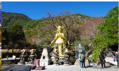
อุทยานน้ำหยก

วันที่สี่ ภูเขาหิมะมังกรหยก (รวมนั่งกระเช้าใหญ่ขึ้นลง)- หุบเขาพระจันทร์สีน้ำเงิน-น้ำตกไป๋สุ่ยเหอ ชมโชว์ IMPRESSION LIJIANG- อุทยานน้ำหยก -เมืองต้าหลี่