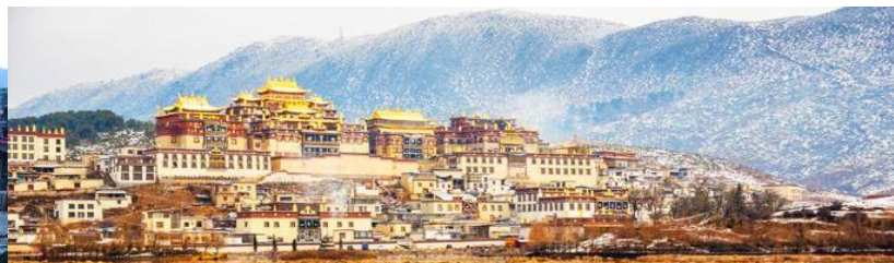
เมืองโบราณเซวกริลา