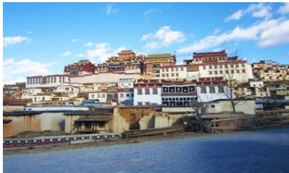
วัดลามะซงจ้านหลิง

ที่ พัค YUE GUANG HOTEL ระดับ 4 ดาวท้องถิ่น หรือเทียบเท่าเมืองจางเจี้ยน หรือแชงกรีล่า