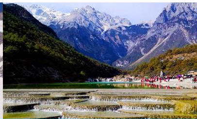
หุบเขาพระจันทร์สีน้ำเงิน "ไปสู่อุทยาน"