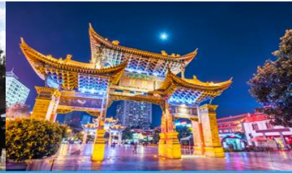
ถนนคนเดินหนานผิงเจีย

วันที่หก เมืองคุนหมิง – ตำหนักทอง – สวนน้ำตก – อีระช้อปปีงย่านถนนคนเดิน ร้าน POP MART เดินทางกลับกรุงเทพฯ (สุวรรณภูมิ)