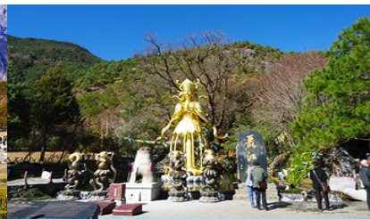
อุทยานน้ำหยก