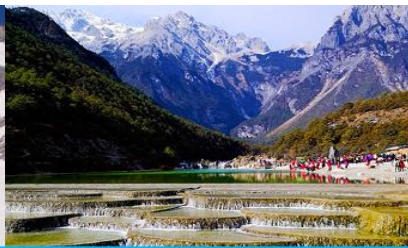
หุบเขาพระจันทร์สีน้ำเงิน "ไป๋สุ่ยเหอ"