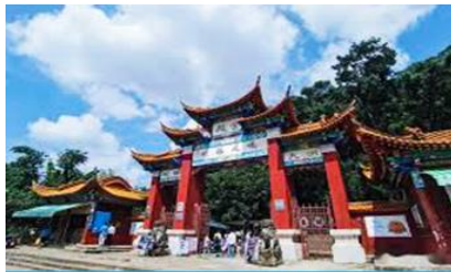
ตำหนักกวางจินเตียน

พักที่ JINJIANG HOTEL โรงแรมระดับ 4 ดาวท้องถิ่น หรือเทียบเท่าในเมืองคุนหมิง